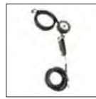
ASTURO Reifenfüll- Station und Reifenfüller (CE-Norm)