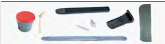
Reifenmontierpaste, Pinsel für Reifenmontierpaste, Montiereisen und 1 Satz Kunststoffeinsätze für Aluminiumfelgen