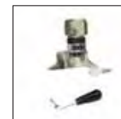
Montagekopf für Konvex Speichenfelgen (VW), komplett mit Kunststoffeinsätze

Für weiteres Zubehör, siehe separater Katalog.