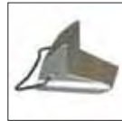
Adapter Set für Reduzierung des Durchmessers um 2 Zoll