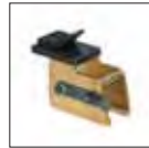
Adapter Set für Erweiterung des Durchmessers um 4 Zoll