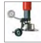
Mechanische Wulstniederhalter Rolle