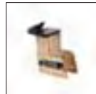
Satz Motorrad Spannklauen Adapter