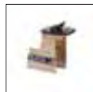
Satz Adapter für Reduzierung der Außenspannung um 4 Zoll