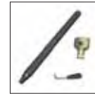
Universal Schnellwechsel Werkzeug für Montagekopf